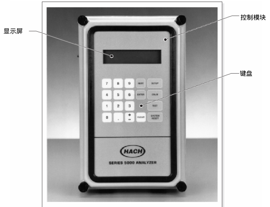
图 2 控制模块