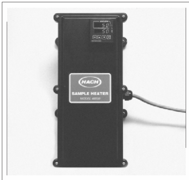
图 16 水样加热器