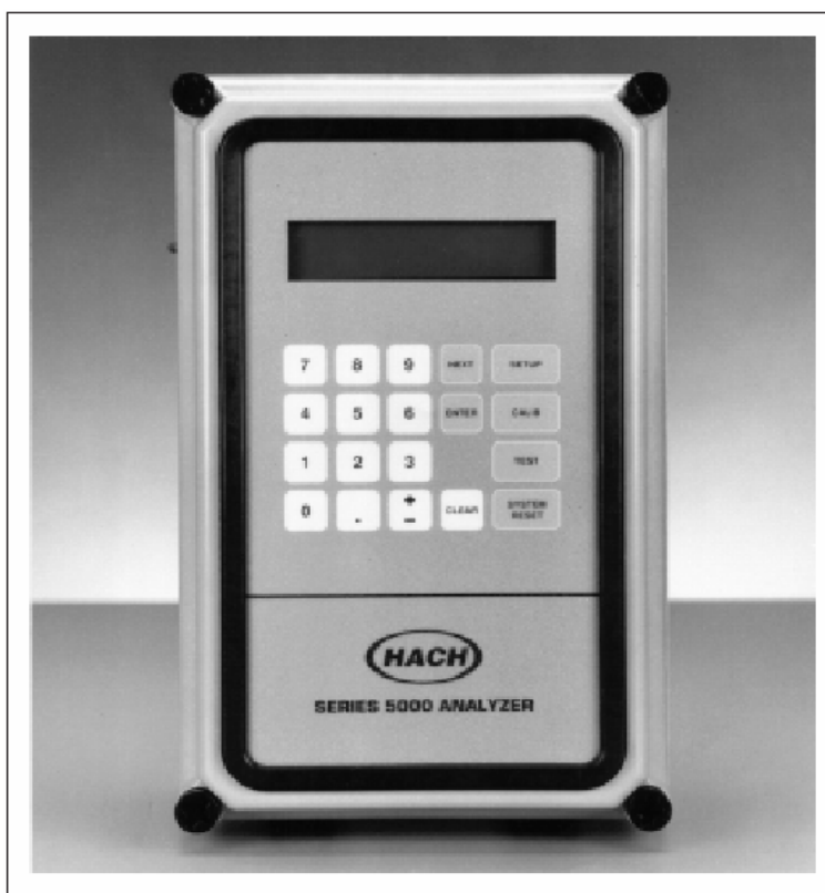
图 6 键盘